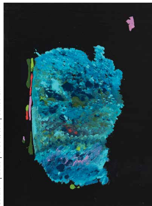
Corais II | 2023 | Óleo s/tela | 60x80 cm