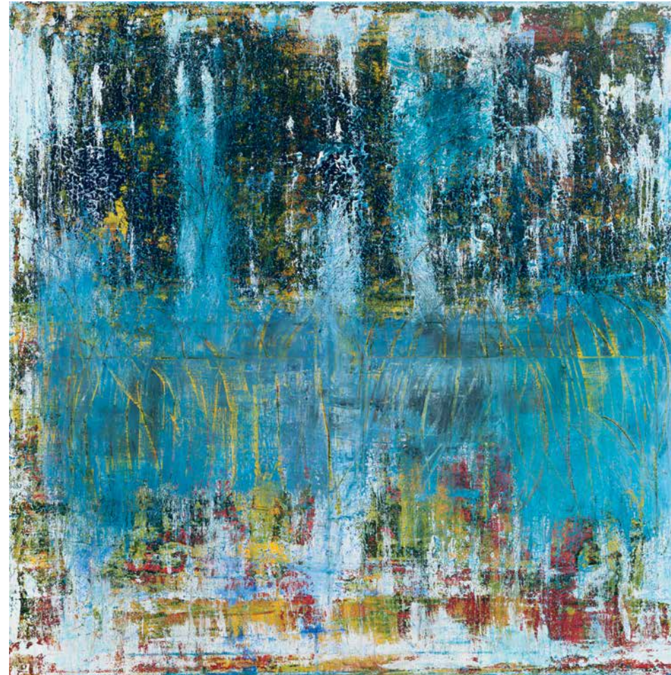
Sem título I | 2015 | Acrílico s/tela | 130x130 cm