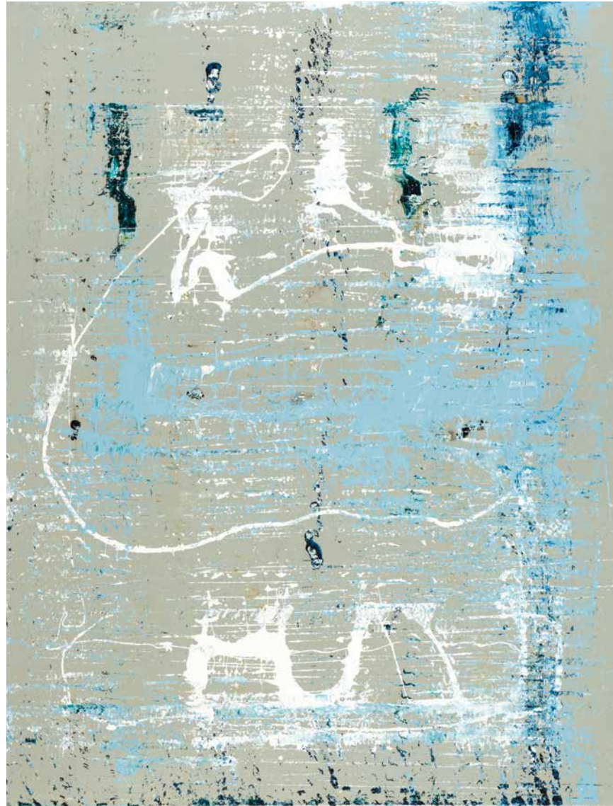
Veneza | 2022 | Óleo s/tela | 89x116 cm