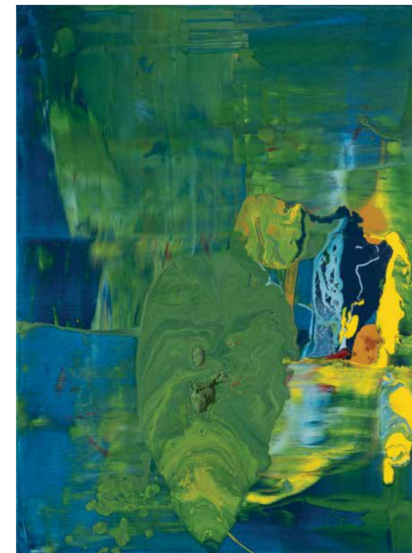
Corais I | 2023 | Óleo s/tela | 60x80 cm

A irreverência do inconsciente, numa arte que perdeu as formas